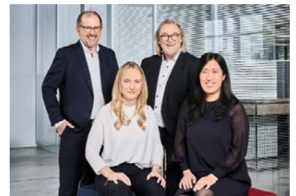
Die Geschäftsführung des Familienunternehmens.