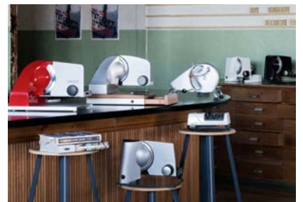
Allerschneider sind das Kernsegment des Küchengeräteherstellers GRAEF.