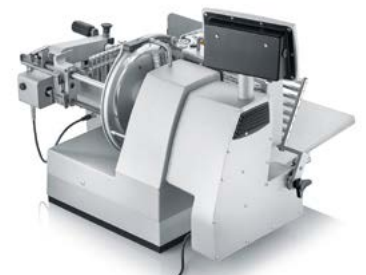
Der Schlüssel zur Prozessautomatisierung: VA900