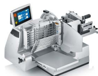
Höchste Produktivität, Effizienz und Hygiene: der VA900