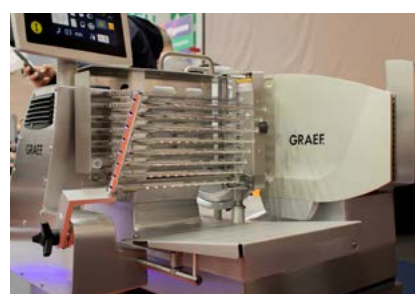
Der VA900 ist ein zuverlässiger Helfer im Theken- und Küchenbereich.