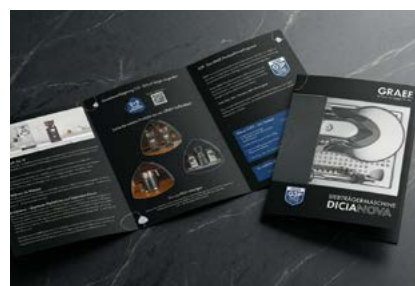
Der Produktflyer im Sonderformat am PoS sorgt für maximale Aufmerksamkeit.