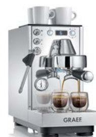
Kompromisslose Espresso performance im schlanken Format