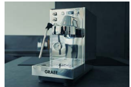
Dicianova: die kompakteste Siebträgermaschine ihrer Klasse