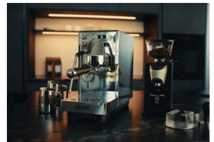
Die Dicianove reiht sich perfekt in die Kaffeewelt von GRAEF ein.