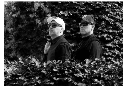
Release-Party im Blue Shell in Köln