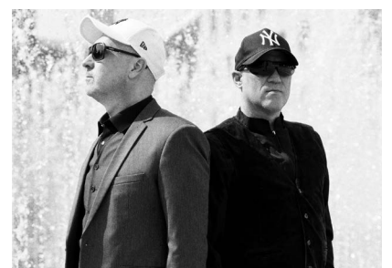
Mit „Fame“ schaffte es die Band bereits in die Pop-Charts in Großbritannien.