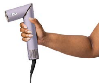
Leistungsstarkes Trocknen und vielseitiges Styling in einem Gerät.