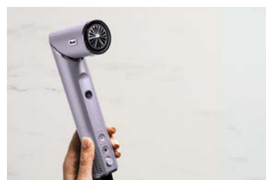
Der Beauty-Bestseller punktet mit seiner Vielseitigkeit.