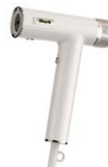
Mit 5 praktischen Aufsätzen sorgt der SpeedStyle für den perfekten Look.