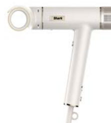
Der Gloss-Finishing-Aufsatz zaubert einen natürlich aussehenden Glow.