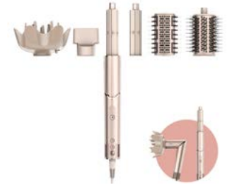
Eines der Produkte vor Ort: der Shark FlexStyle