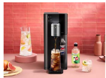
Marktstart Mitte Juli: Sodastream launcht ULTIMATE MULTI-DRINK™ Getränkesprudler