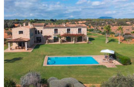
THE BALANCE Rehab Clinic berichtet über das erfolgreiche Jahr 2025