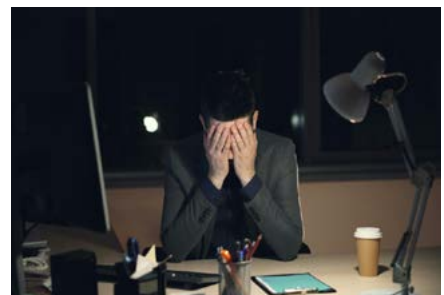
Mentale Gesundheit im Trend – immer mehr Männer lassen sich klinisch aufgrund mentaler Probleme behandeln