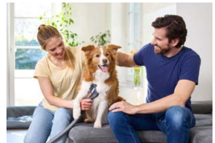
THOMAS steht seit Jahrzehnten für leistungsstarke Reinigungssysteme.