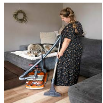
Der THOMAS AQUA+Pet & Family entfernt Tierhaare und Flecken.