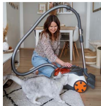
Der CYCLOON HYBRID ist perfekt für gesundheitsbewusste Familien.