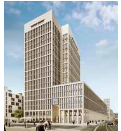
Das MainTor Ensemble in Frankfurt am Main