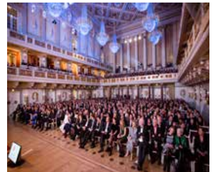
Würdiger Abend für die Red Dot Gala: das Konzerthaus am Gendarmenmarkt