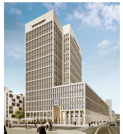
Das MainTor Ensemble in Frankfurt am Main