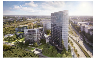
Fernansicht der Bavaria Towers