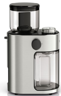
Die neue Braun Kaffeemühle FreshSet mahlt mit 15 verschiedenen Mahlgradeinstellungen.