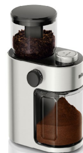
Die professionelle Scheibenmahlwerk-Technologie sorgt für ein gleichmäßiges Mahlergebnis.