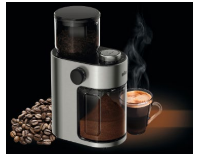
Die neue Kaffeemühle FreshSet von Braun