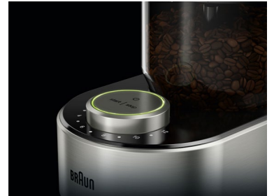
Der Kaffee wird bei geringer Hitze gemahlen, dass das volle Aroma der Bohnen erhalten bleibt.