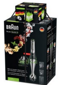
Stabmixer MQ 9045X