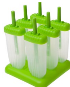
Erfrischende Alternative: selbst gemachtes Lieblingseis mit der 6er-Form für Eis am Stiel.