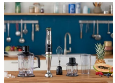
Mit dem MultiQuick 9 von Braun ist man bestens ausgestattet.