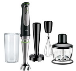
Stabmixer MQ 9037X