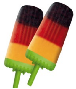
Das Rezept für ein Eis in Schwarz-Rot-Gold – visuell wie auch geschmacklich ein Genuss.