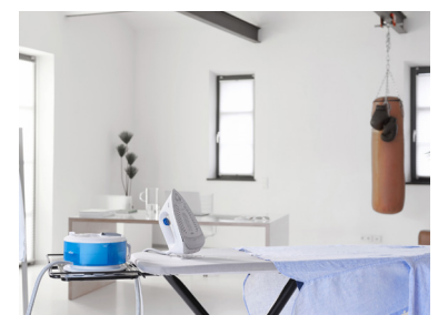
Braun CareStyle Compact erleichtert das Bügeln