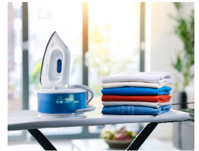
Hauptakteur des Spots – die CareStyle Compact von Braun