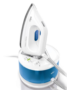
Braun CareStyle Compact IS2043