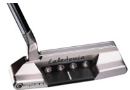
Caledonia Vidi Vici – Cool Silver – ab 990,- € (UVP)