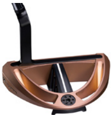
Caledonia Full Mallet – Copper Rose – ab 890 € (UVP)