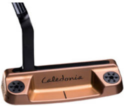
Caledonia Big Eye – Copper Rose – ab 750 € (UVP)

Die Premiummodelle von Caledonia sind die individuellsten Putter, die es aktuell auf dem Markt zu kaufen gibt. Die Designhighlights, „made in Gerny“, lassen sich exakt an den eigenen Schwung anpassen. Perfekt für alle, die keine Kompromisse eingehen wollen und ein Auge für Design haben.