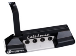
Caledonia Vidi Vici – Deep Black – ab 990,- € (UVP)