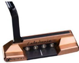
Caledonia Vidi Vici – Copper Rose – ab 990,- € (UVP)