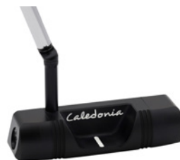
Caledonia Darling – Deep Black – ab 499 € (UVP)