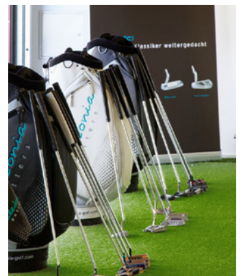
Das Putting Performance Center