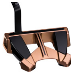
Caledonia Viper – Copper Rose – ab 1.190 € (UVP)