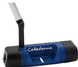
Caledonia Darling – Horizon Blue – 499 € (UVP)