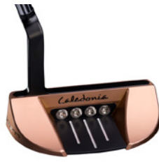
Caledonia Lineo – Copper Rose – ab 990 € (UVP)