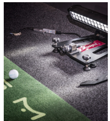
Das Putting Performance Center