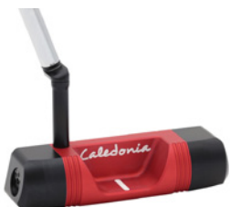
Caledonia Darling – Chili Red – 499 € (UVP)

Im Prefitted Modell „Darling“ hat die Präzisionsschmiede Caledonia ihr gesamtes Expertenwissen gebündelt und auf die Ansprüche unterschiedlichster Spielertypen ausgerichtet – damit wird das Modell auf dem Grün buchstäblich zu „Everybody's Darling“. Perfekt für alle, die Wert auf einen handlichen Putter legen, der neueste wissenschaftliche Erkenntnisse in sich vereint.