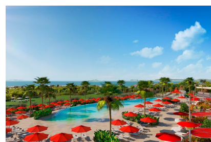
Club Med Magna Marbella wartet mit einem 900 m 2 großen Lagunenpool auf.