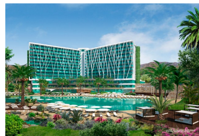
Das Club Med Resort Magna Marbella