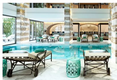
Ein Zen-Pool bietet Erwachsenen Entspannung.