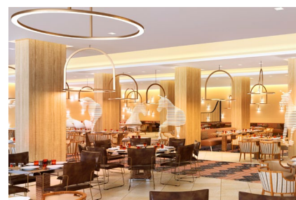
Das neue Flaggschiff für Familien und Paare: Club Med Magna Marbella