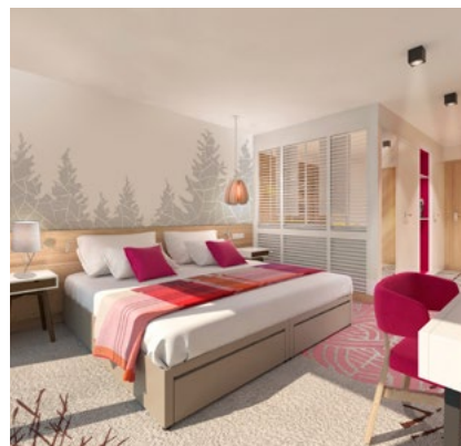
Modern-gemütlich: Doppelzimmer im Club Med Les Arcs Panorama