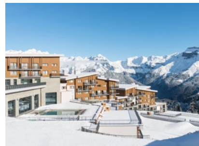
Auch mit dem Auto schnell zu erreichen: Club Med Grand Massif Samoëns Morillon