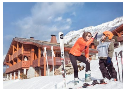
Perfekt für Familien: Chalet-Apartments im Club Med Valmorel