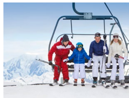
Skispaß mit Club Med