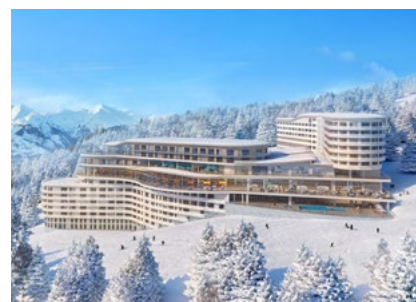
Eröffnung Dezember 2018: Club Med Les Arcs Panorama