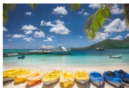
El Dorado für Wassersportler im Club Med Les Boucaniers auf Martinique