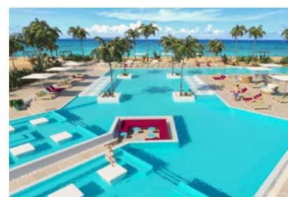
Ab Winter 2019: Neuer Infinitypool im Club Med Turquoise auf den Turks & Caicosinseln