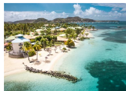
Club Med Les Boucaniers auf Martinique