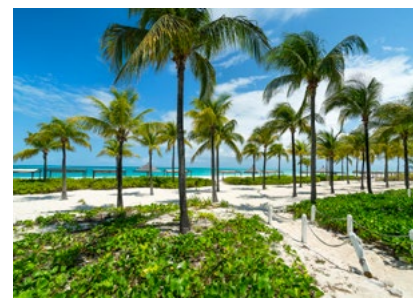
Karibikparadies von Club Med