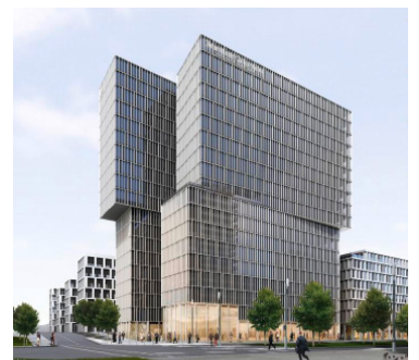
Das Frankfurter Landmark-Projekt von Eike Becker_Architekten soll 2022 fertiggestellt sein.