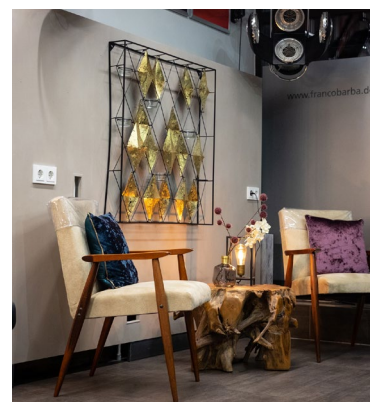
Cut & Color überzeugt außerdem durch das selbstentworfene und handgefertigte Mobiliar.