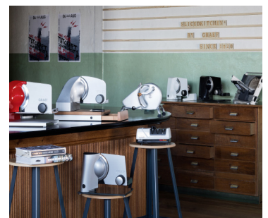
Qualität, die sich durchsetzt – die Alleschneider von GRAEF