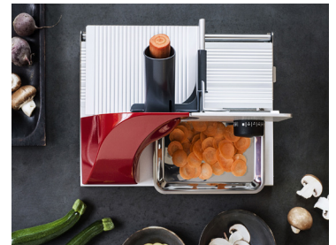
Bis Ende 2020 gratis zu jedem Alleschneider: der MiniSlice-Aufsatz