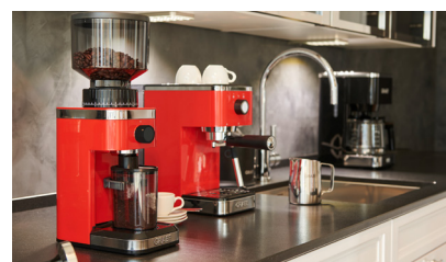
Die GRAEF salita in weihnachtlichem Rot ist das ideale Einstiegsmodell für jeden Kaffeeliebhaber.