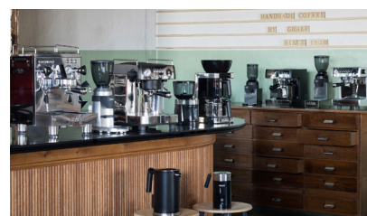
Must-have für jeden Genießer: die GRAEF CoffeeKitchen-Serie.