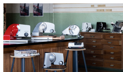
Die GRAEF Alleschneider schneiden Lebensmittel in hauchdünne Scheiben.