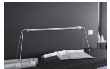
RIMA wurde 2017 bei dem Wettbewerb „Manufaktur-Produkt des Jahres“ ausgezeichnet.