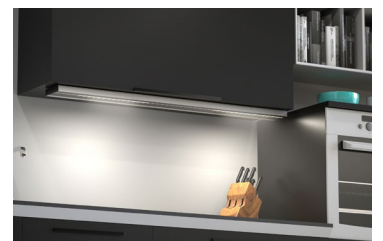
Wie alle Leuchten von HOLY TRINITY ermöglicht AREA individuelle Gestaltung durch intuitive Bedienung.