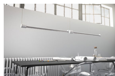
Pendelleuchte KALA von HOLY TRINITY