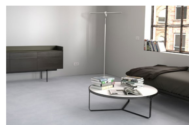
Stehleuchte ORON von HOLY TRINITY