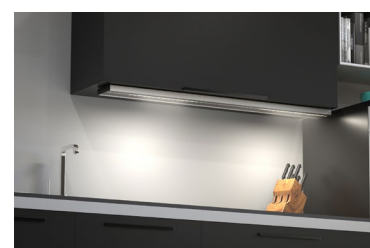
Unterbauleuchte AREA von HOLY TRINITY