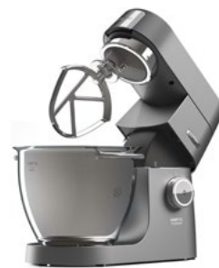
Kenwood Chef XL Titanium