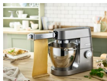
Kenwood Chef XL mit Lasagnewalze