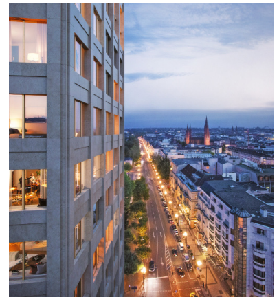
Der 64 Meter hohe Wohnturm KURECK wird zu Wiesbadens neuer erster Adresse.