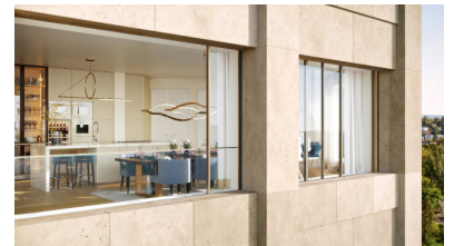
Die Window Loggias ermöglichen das komplette Öffnen der Fensterfronten.