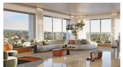
Im Wohnturm KURECK entstehen 66 einzigartige Wohneinheiten, die einen atemberaubenden Blick über Wiesbaden ermöglichen.