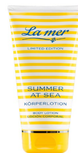
Die La mer Summer at Sea Körperlotion