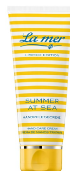
Die La mer Summer at Sea Handpflegecreme