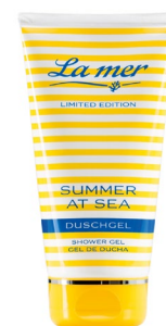
Das La mer Summer at Sea Duschgel