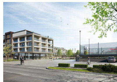
Auf dem 48.000 qm großen Gelände entstehen unter anderem ein Hotel, ein Internat und ein Pro Shop.