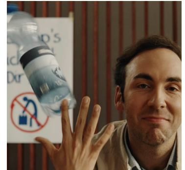
Schlepp's nicht mit dir rum! SodaStream beginnt das neue Jahr mit einem TV-Kracher.