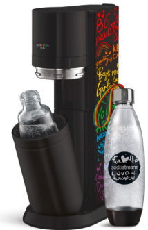
SodaStream bringt die neue DUO als stark limitierte handmade Pride-Edition im Rainbow-Design heraus.