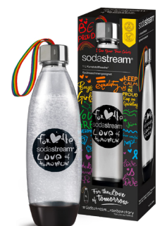
Ebenfalls im Pride-Look: 1-Liter-Kunststoffflasche mit Trageschleife im Regenbogendesign.