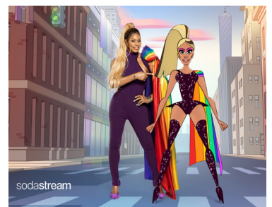
SodaStream setzt Laverne Cox in dem bezaubernden Animationsfilm „Rainbow Story“ in Szene.