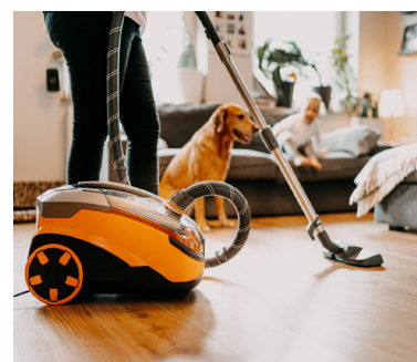
Der AQUA+ Pet & Family Parquet Pro mit spezieller Parkettreinigungsdüse