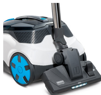
Der CYCLOON HYBRID LED PARQUET mit Universalbodendüse inklusive LED-Licht