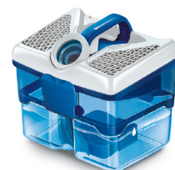
Feinstaub, Schmutz, Allergene werden sicher in der AQUA-Filterbox gebunden