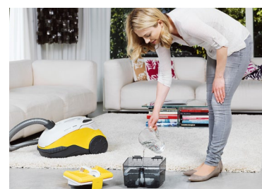
Das Befüllen der AQUA-Frischebox ist kinderleicht.