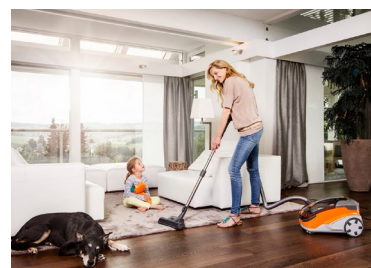
Frishesaugen mit der innovativen THOMAS AQUA-Technologie.