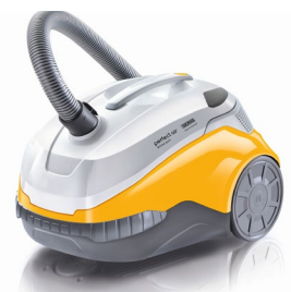
Der THOMAS perfect air animal pure