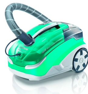
THOMAS AQUA+ MULTI CLEAN X10 PARQUET