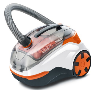
Der THOMAS CYCLOON HYBRID Pet & Friends