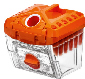
Trennt Grob- und Feinststaub: die THOMAS easyBOX