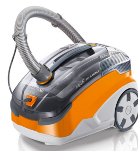
Der THOMAS AQUA+ PET & FAMILY mit Wisch-Saug-Funktion