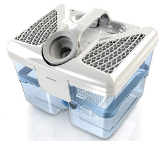
Frischesaugen mit der THOMAS AQUA-Frische-Box