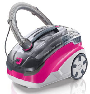
Der THOMAS AQUA+ ALLERGY & FAMILY