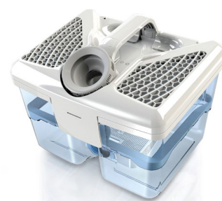
Die AQUA-Frische-Box von THOMAS