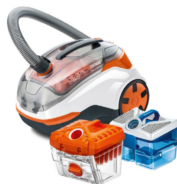
Der CYCLOON HYBRID Pet & Friends ersetzt den Beutel durch zwei Filterboxen