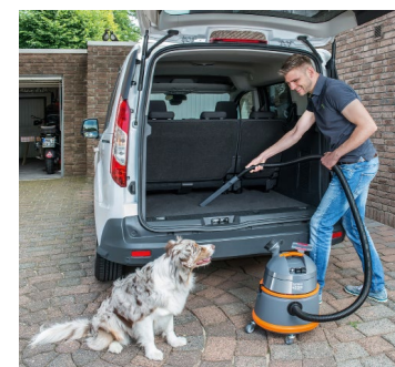
Autoreinigung wie vom Profi mit dem praktischen Waschsauger THOMAS BOXER