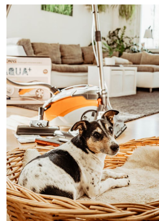
Die THOMAS AQUA+-Modelle überzeugen durch ihre Multifunktionalität