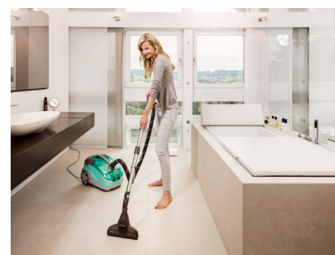
Der THOMAS AQUA+ MULTI CLEAN X10 PARQUET sorgt für strahlende Böden