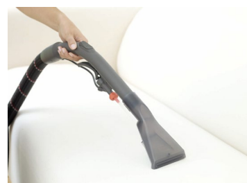
Mithilfe der Sprüh-Wisch-Saug-Funktion sind Polster- und Sofabezüge wieder frisch