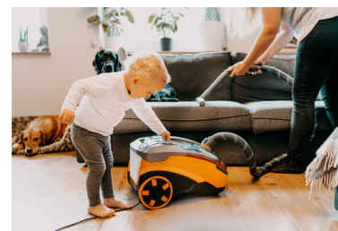
Der ParquetPro ist dank seiner hohen Leistung besonders saugstark.