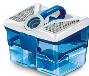
Die AQUA-Filterbox der THOMAS Staubsauger sorgt für frische Raumluft.