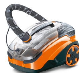
Der AQUA+ Pet & Family ParquetPro reinigt empfindliche Böden besonders schonend.