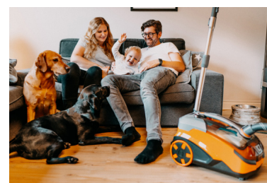
Der ParquetPro sorgt für Sauberkeit im Familien- und Tierhaushalt.