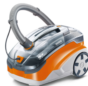
Der THOMAS AQUA+ Pet & Family, wischt und saugt gleichzeitig.