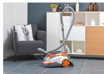
Der THOMAS CYCLOON HYBRID Pet & Friends vereint Saugkraft und Effizienz.