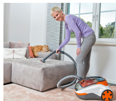
Haustierhalter saugen mehrmals die Woche, die Hälfte von ihnen bis zu 45 Minuten lang.