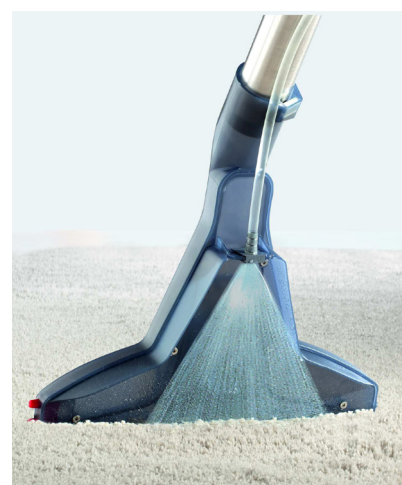
Die THOMAS Sprühhex-Düse mit integrierter Sprüh-Wisch-Saug-Funktion.