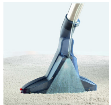
THOMAS AQUA+ Pet & Family mit integrierter Sprüh-Wisch-Saug-Funktion