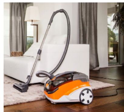
Der Tierliebhaberstaubsauger THOMAS AQUA+ Pet & Family