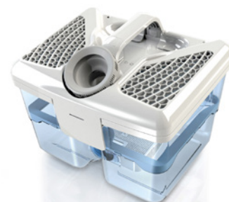
THOMAS AQUA-Filter-Box bindet Schmutz, Staub und Tierhaare in Wasser