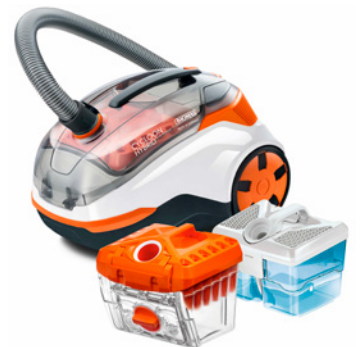
THOMAS CYCLOON HYBRID Pet & Friends mit Zyklon easyBOX und AQUA-Frische-Box