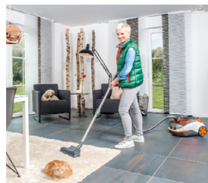
THOMAS CYCLOON HYBRID Pet & Friends eignet sich bestens im Tierhaushalt