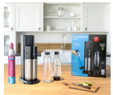
SodaStream DUO – erstmals mit einem dualen System