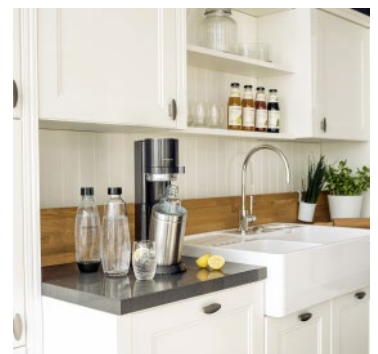
Mit einer Höhe von nur 44 cm passt die DUO unter fast jeden Küchenschrank.