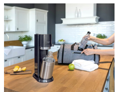
Die DUO bringt die Nachhaltigkeitsmission von SodaStream von den Haushalten auf die Straße, denn Verbraucher können mit ihr auch unterwegs auf Einwegplastikflaschen verzichten.