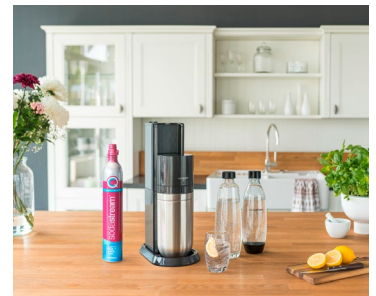
Mit der neuen DUO von SodaStream zieht ein wahrer Alleskönner in die Küche ein.