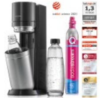
Die neue SodaStream Wassersprudler-Generation DUO