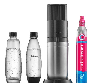
Die DUO sprudelt gleich im Doppelpack – nämlich Glas- und Kunststoffflaschen!