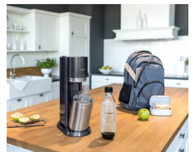
Selbst gesprudeltes Getränke genießen – sowohl zu Hause als auch unterwegs.