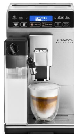
Autentica Cappuccino ETAM 29.660.SB